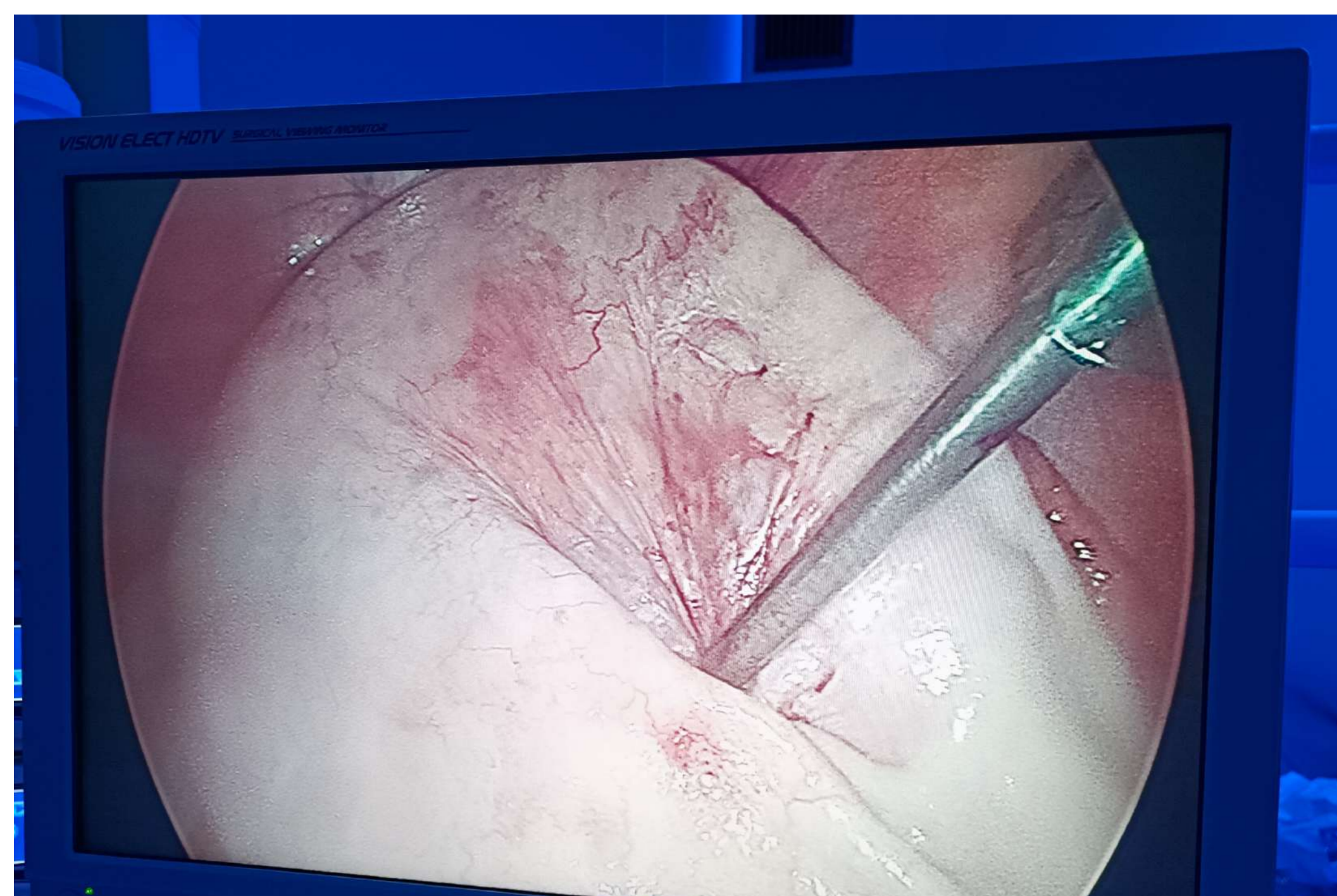
Figura 1: Drenaje de quiste durante laparoscopia

Cistoadenoma mucinoso de tipo endocervical, benigno paratubárico.