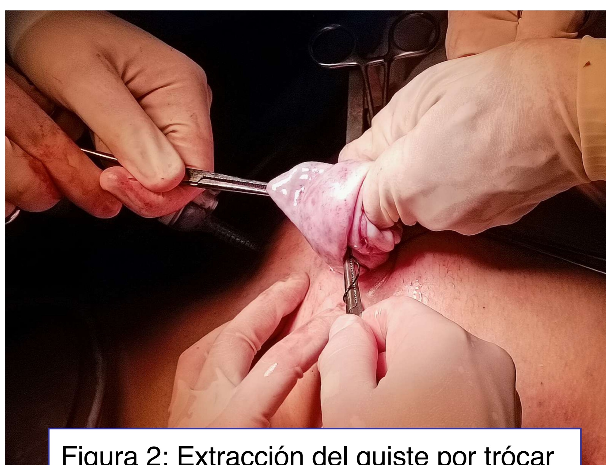
Figura 2: Extracción del quiste por trócar