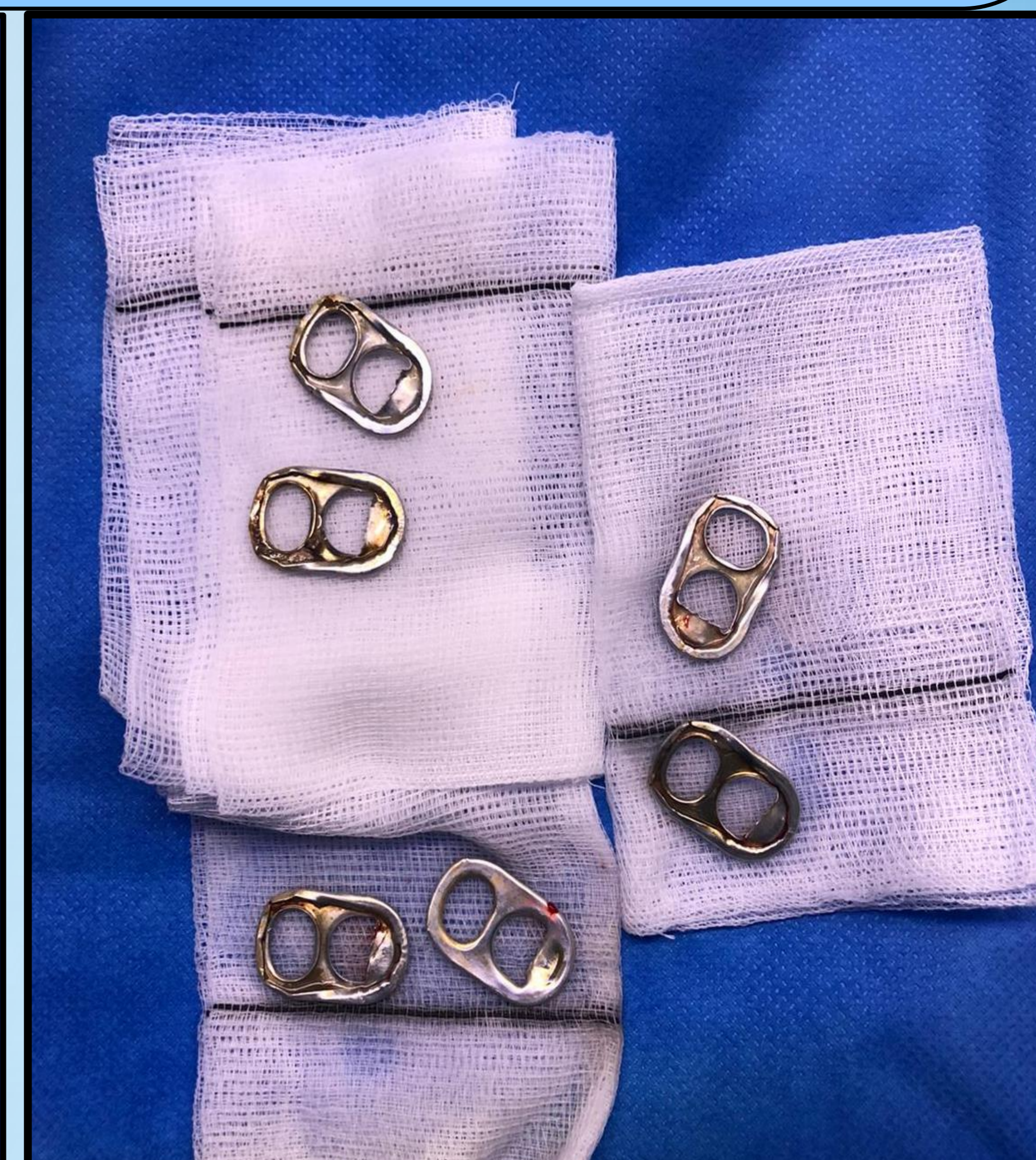
Imagen 3: 6 anillas de lata de refresco extraídas de vagina.