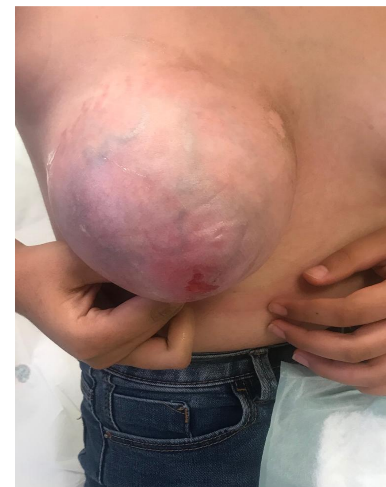
Aspecto de la lesión mamaria cuando la paciente consulta en urgencias